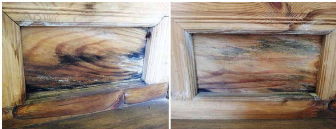
Fig. 3. Severe surface mold damages of the interior of Cheonseokjeong.

의 경우에는 습하던 외기가 건조해지면 바로 반응하여 실내 상대습도가 내려가지만 비개방 전각 경우에는 외기 상대습도 변화에 반응하여 실내 상대습도가 다시 내려가는데 다소 시간이 걸리기 때문이다. 따라서 큰 차이라고 볼 수는 없지만 전각의 개방이 실내 목재의 표면오염균 피해 측면에서 비개방보다 유리하다고 할 수 있다. 오히려 비개방 전각의 경우 장마철에 비가 그치고 햇빛이 나면서 외기 상대습도가 낮아질 때는 전각의 문을 일시적으로 개방하여 내부 습기를 외부로 배출시킬 필요가 있다고 본다.